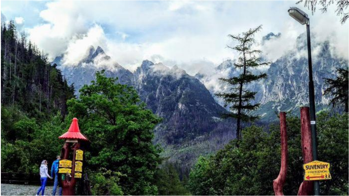
Hoge Tatras gebergte - Slowakije