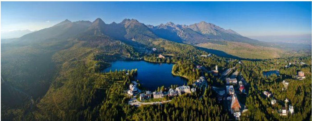
Gletsjermeer van Štrbské Pleso